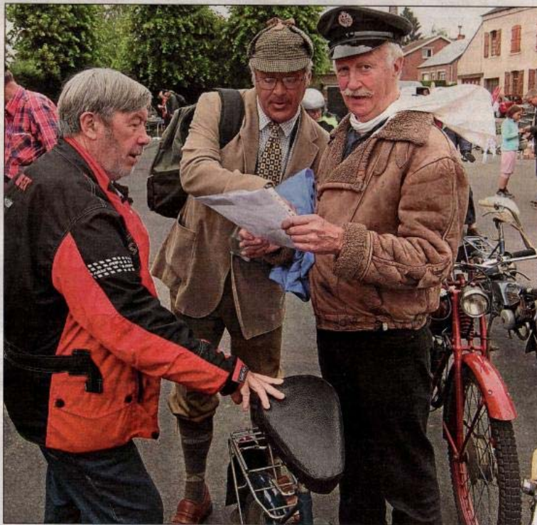
Parmi les participants à la rando cyclos sarséenne, un groupe de fidèles très « British ».

150 Anglais, Belges, Français et Néerlandais ont enfourché leur mob pour sillonner les routes de l'Avesnois. En milieu d'après-midi un arrêt a été marqué de l'autre côté de la frontière belge, sur la place principale de Momignies. C'est là que - on le craignait depuis le matin - les premières gouttes ont commencé à tomber et où on a entendu les premiers coups de tonnerre... Mais la pluie n'a pas insisté et