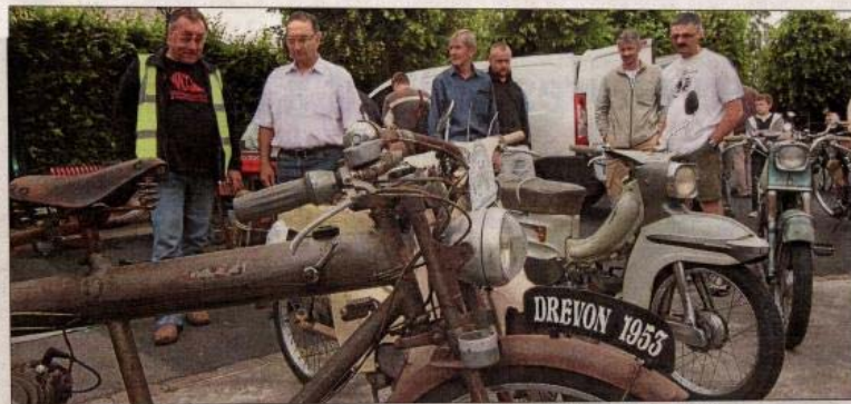
Un véritable musée en plein air s'installe tous les ans sur la place du kiosque à Sars-Poteries.